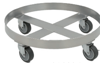
ドラム缶台車十字型