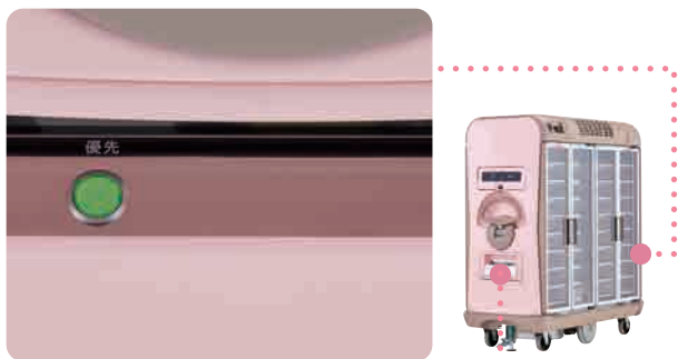
メインコントローラー

自走ハンドルを反対側からでも操作可能にするオプション。反転できない狭い場所で後退する時などに便利です。