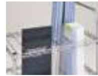
収納するカテーテルの大きさに合わせて間仕切りの位置を変更できます。