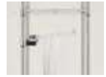
棚板やフックの高さが調整できます。