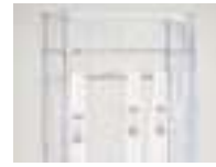
カテーテルの汚れを防ぐカバー付き。