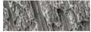
不織布に編み込まれた0.52デニールのマイクロファイバー