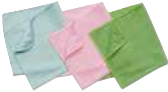
RMQ630BL RMQ620PK RMQ620GN