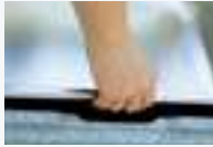
取り出しやすいスペース