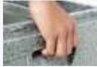
持ち運びやすい取っ手