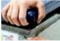
密閉性の高いフタ