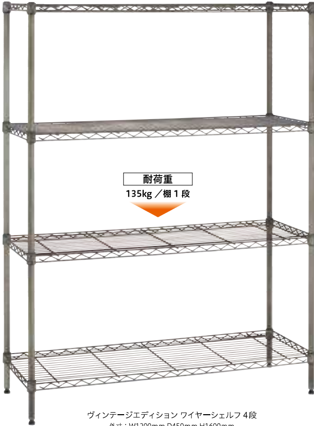
ヴィンテージエディション ワイヤーシェルフ 4段 外寸：W1200mm D450mm H1600mm