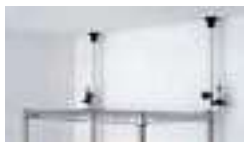
セーフティポスト P.135