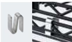
アドオンシェルフコネクター P.136