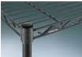
ワイヤーシェルフ