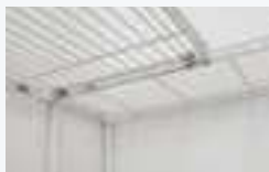
コネクターの付け方