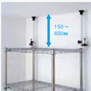
シェルフの後側両端にセーフティポストを取り付けます。