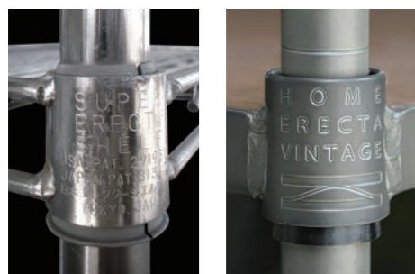
[左]スーパーエレクターシェルフ発売当時の刻印 [右]ヴィンテージシリーズの刻印

もちろん、ライフスタイルに合わせて思いのままに組み合わせることができるフレキシビリティは健在だ。そんな、歴史と情熱を宿す本物のヴィンテージスタイルをぜひ楽しんでほしい。